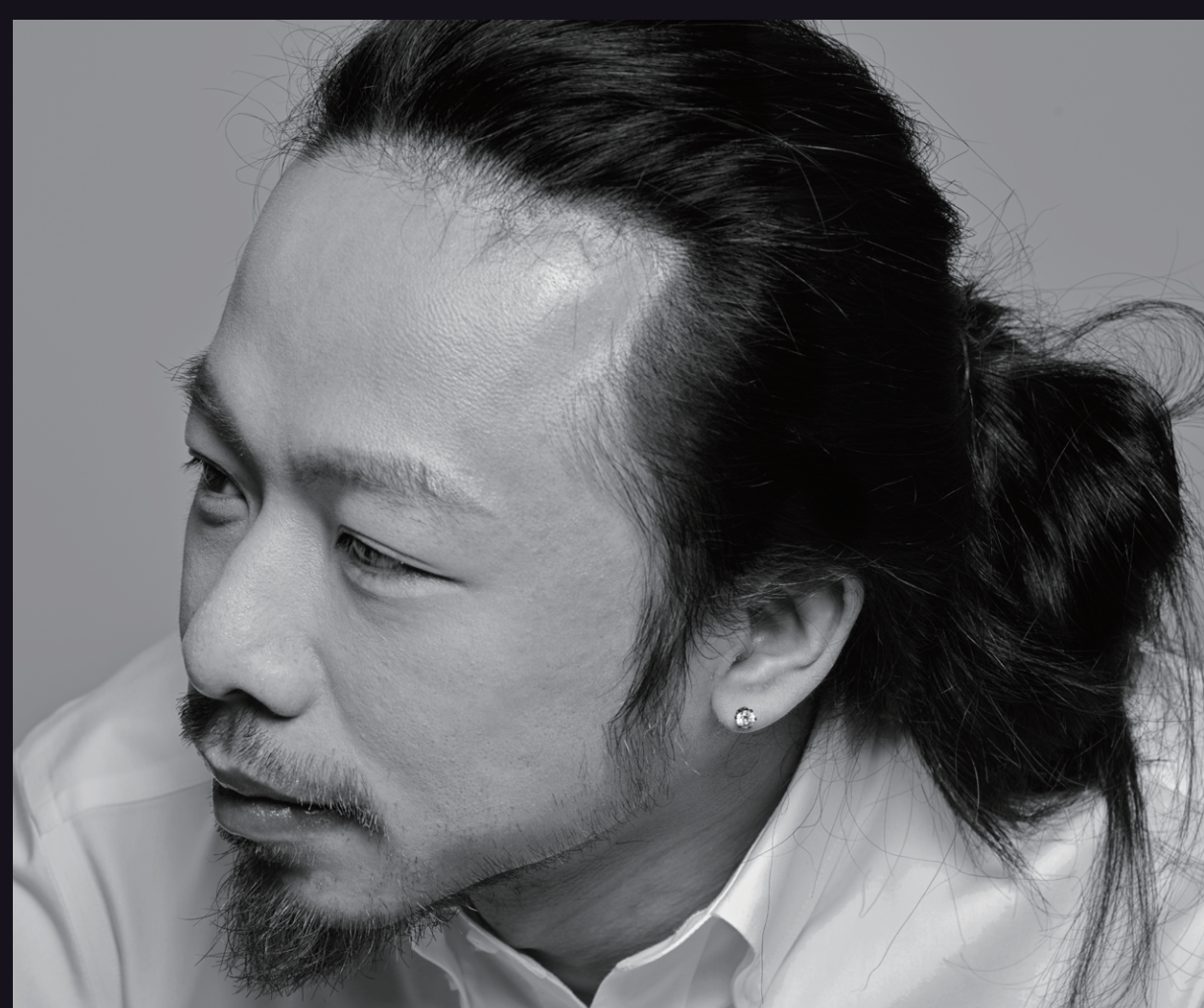
導演、編劇及佈景設計 羅文偉

2012年畢業於香港演藝學院，主修燈光設計，期間獲頒周生生證券獎學金及演藝學院友誼社獎學金。2017年加入城市當代舞蹈團任駐團燈光設計。