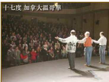
十七度 加拿大溫哥華