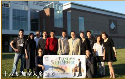
十六度 加拿大多倫多