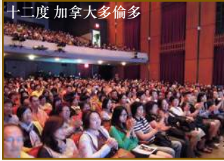
十二度 加拿大多倫多