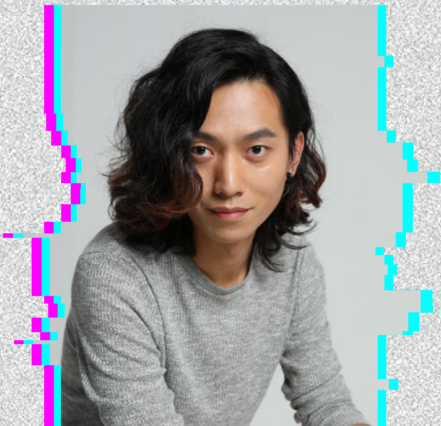
改編及導演 李曉龍